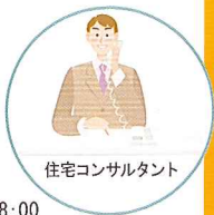
住宅コンサルタント

関東地域... ネクスト・アイズ株式会社 東京本社 東京都港区麻布十番1-3-1 アポリアビル5F