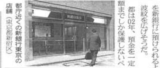
都庁近くの新銀行東京の店舗(東京都新宿区)

都は02年、預金を一定額までしか保護しないべしと、新銀行に預けられるようになる。都による新たな支援策との見方もあり、波紋を広げさせた。 イオ解禁に合わせて、公金運用の基準として貸付金管理方針を策定。格付けや自己資本比率、預金量の推移を組み合わせた独自基準を定め、この基準を満たす金融機関に預け金社からの取得を求められている。 新銀行は現在、取得する格付けが1社のみなど、都が預金できる基準には該当しない。だが、今回の改定で、金融機関が都債を満期まで保有する「証書方式」で引き受